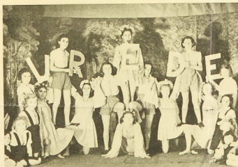
Een scène uit het vredesballet