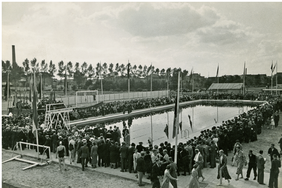
▲ Zicht op de aanwezigen bij de feestelijke opening van het zwembad.